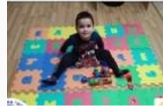
Буквички вълшебни – Трета група Изобразителни дейности