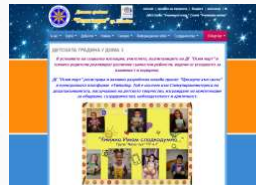
Информация в сайта на детската градина