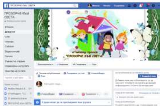
Създадена FВ група